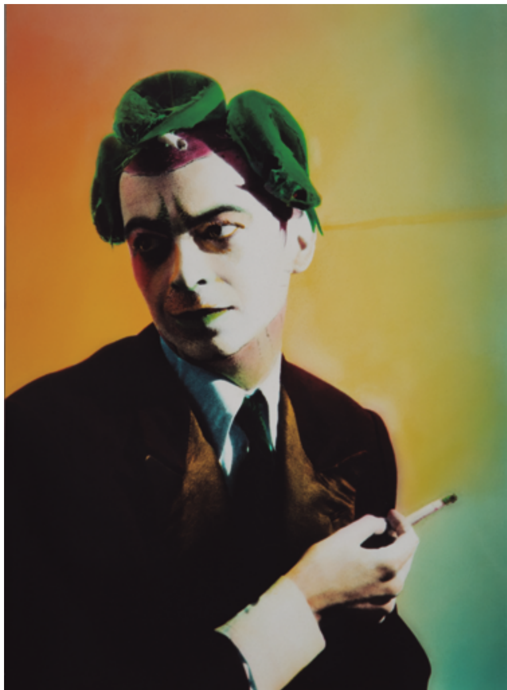
OUKA LEELE, El HORTELANO FUMANDO, 1978 (ED. 2007). FOTOGRAFIA ANALÓGICA Y AGUARELA ENCAPSULADA EN METACRILATO, 28 X 21 X 3 CM