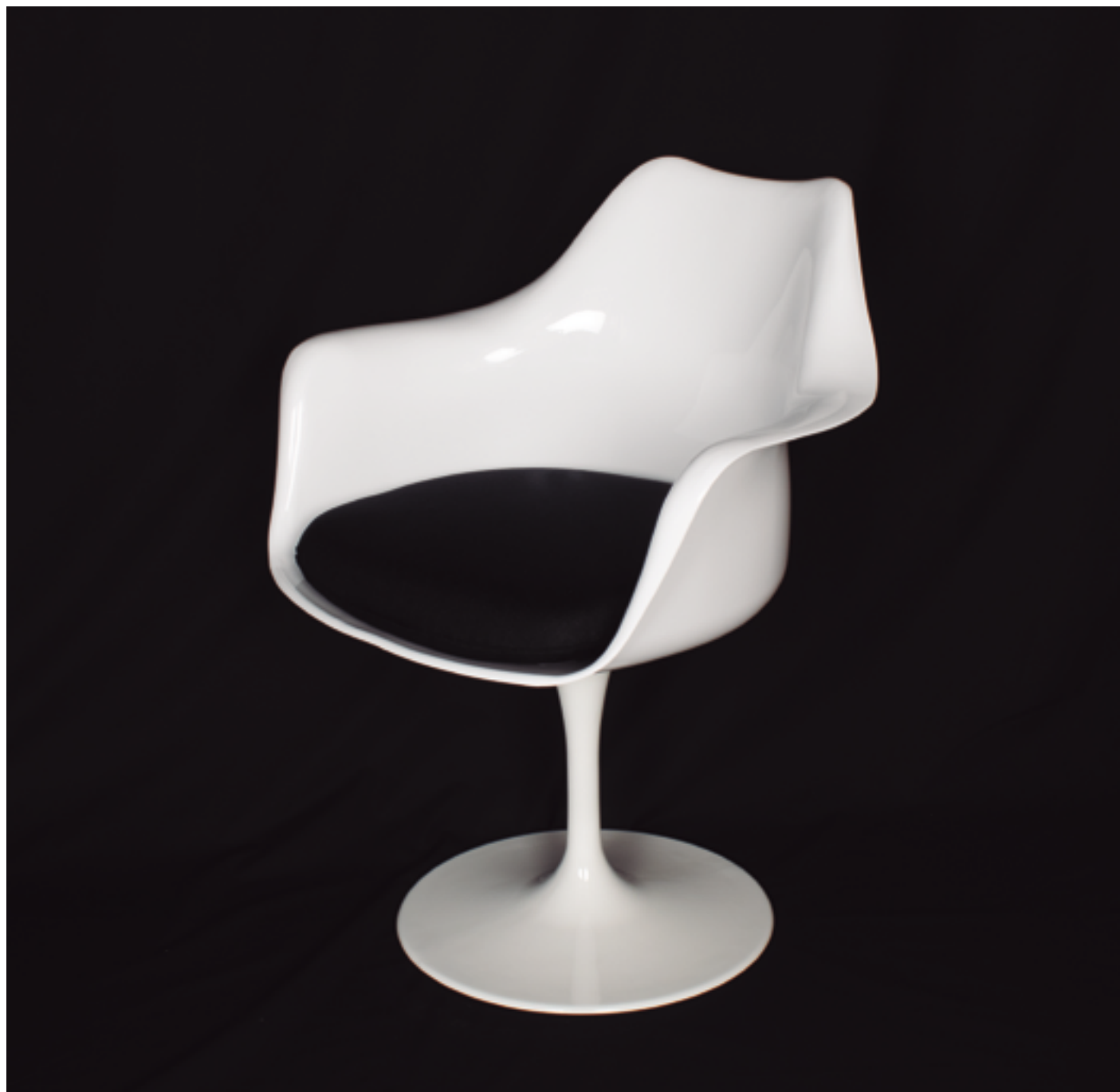
COPIA DE LA SILLA TULIP DE EERO SAARINEN, PARA KNOLL, 1957. PLÁSTICO REFORZADO CON FIBRA DE VIDRIO Y ALUMINIO, 80 x 50 x 47 CM