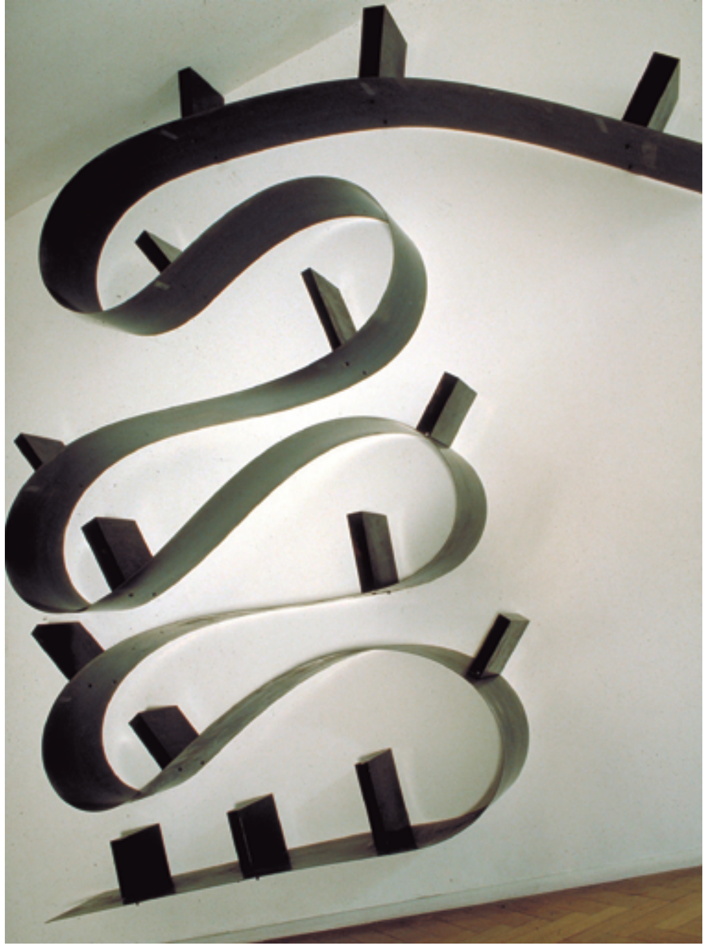
RON ARAD, ESTANTERÍA BOORWORM, 1993, PVC COLOREADO E IGNÍFUGO, MEDIDAS VARIABLES SOBRE MÓDULOS DE 10X50 CM.