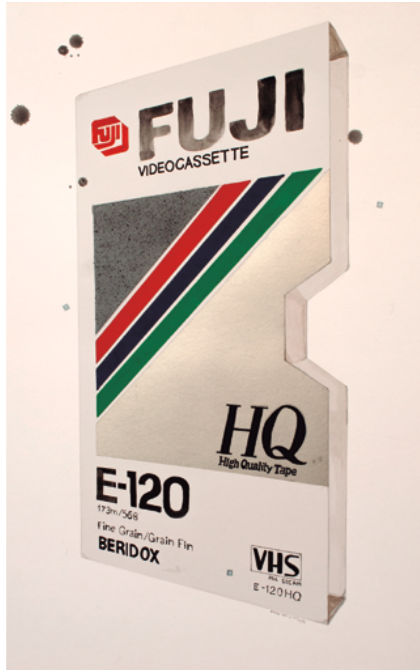
ALEJANDRA DE LA TORRE, VHS, TÉCNICA MIXTA SOBRE PAPEL, 70 X 50 CM ACUARELA, LÁPIZ, LÁPICES DE COLORES, ROTULADOR DE ACRÍLICO, ROTULADOR PERMANENTE SOBRE PAPEL MATSUSHITA (PANASONIC), JUNTO CON UN GRUPO AMPLIO DE LICENCIATARIAS, ESTUCHES DE CINTAS VHS, DESDE 1976. CAJA IMPRESIÓN SOBRE CARTÓN, 26 X 14 X 2,5 CM.