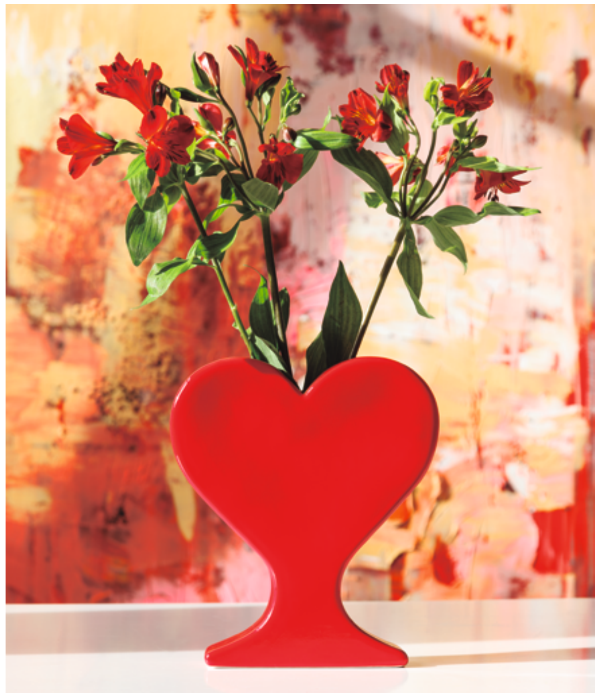
PEPA REVERTER, TOT COR, 2018. CERÁMICA ESMALTADA, 25,5 x 29,5 x 7 CM