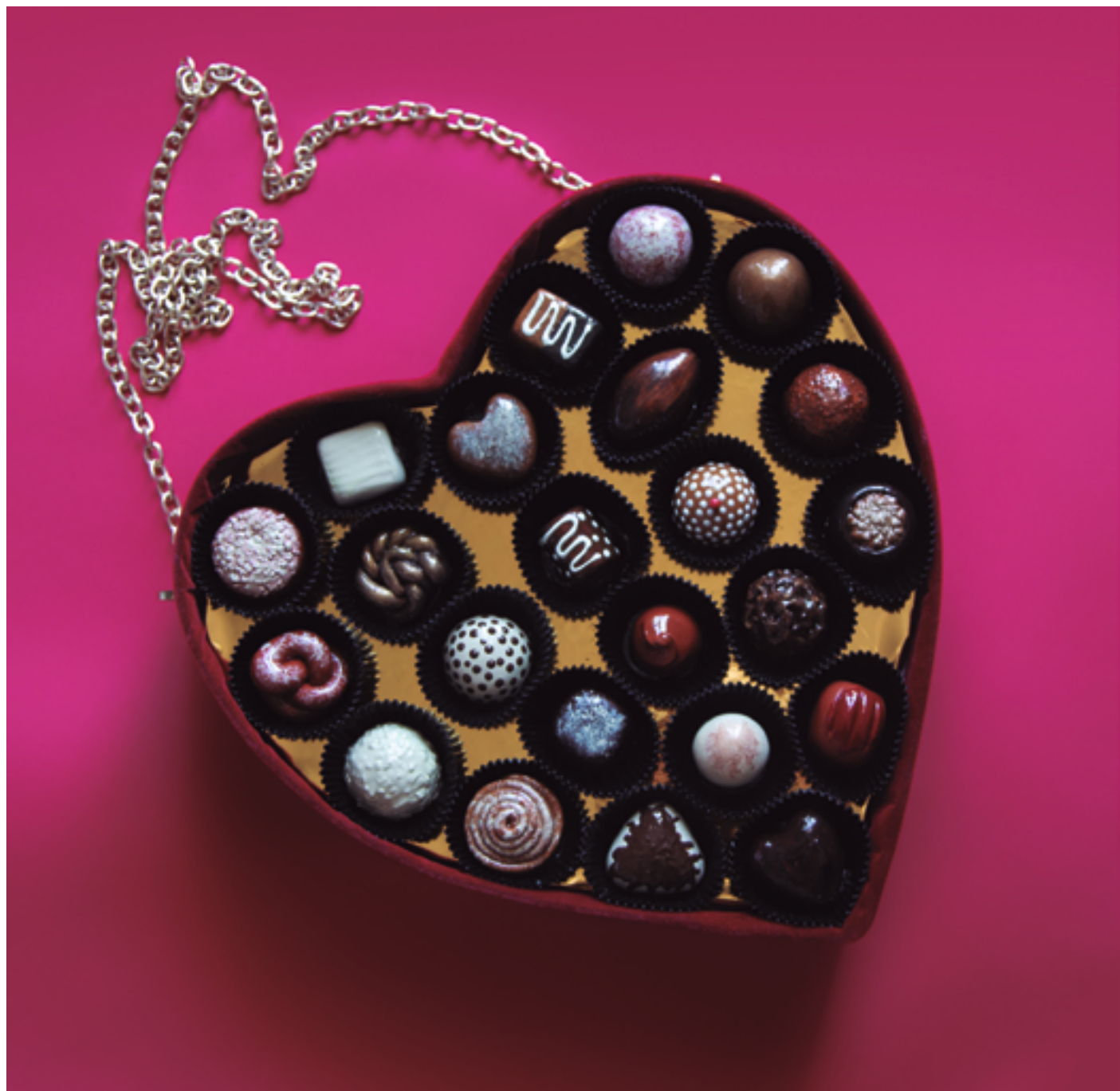
MARINA SALAZAR, BOLSO CAJA DE BOMBONES, 2020. PLÁSTICO, ACRÍLICOS Y CADENA METÁLICA, 25 X 25 X 9 CM