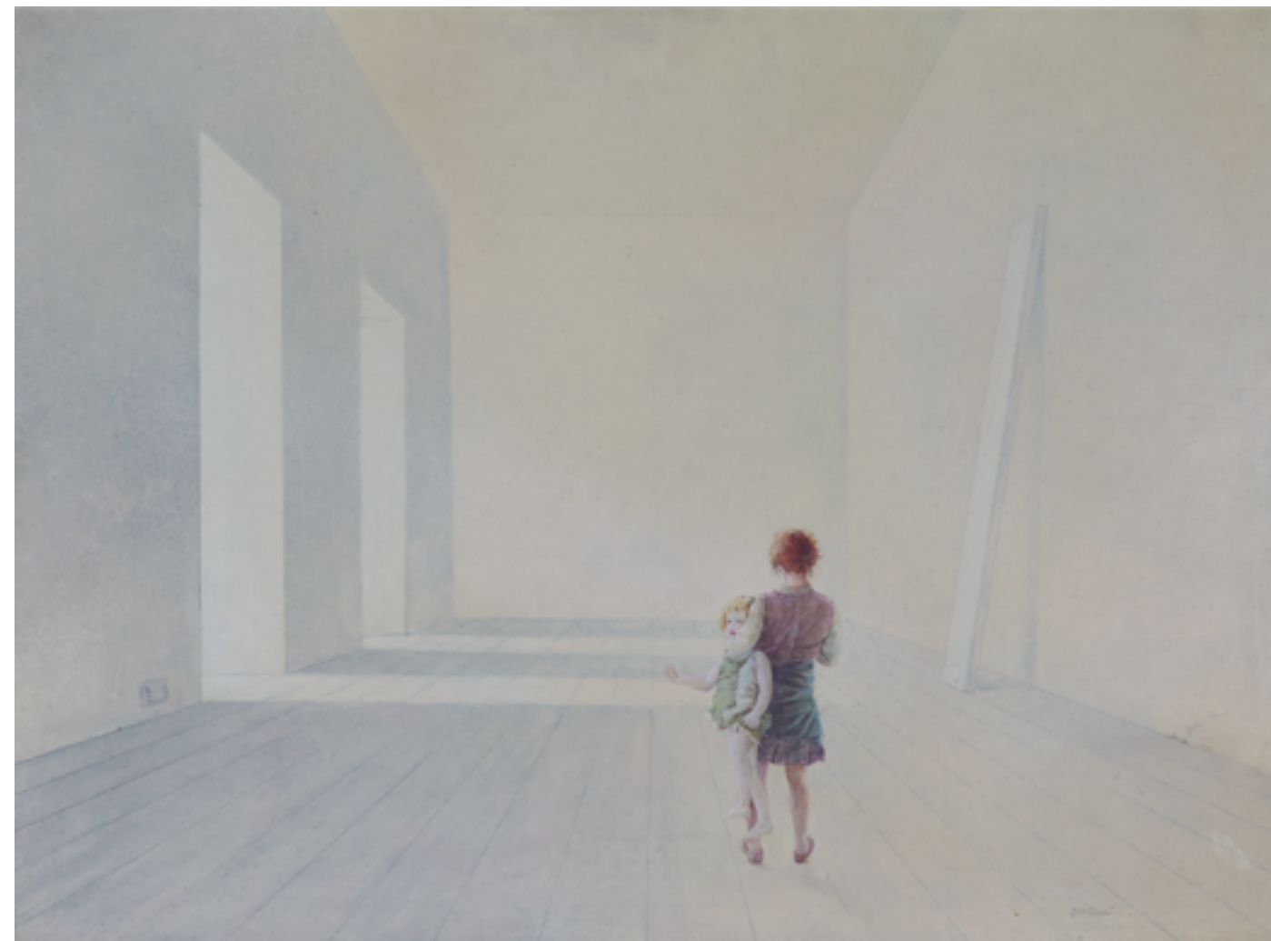
SALVADOR MONTESA, ESTANCIA DESPOJADA VI, 1987. ÓLEO SOBRE TÁBLEX, 60 x 81 CM