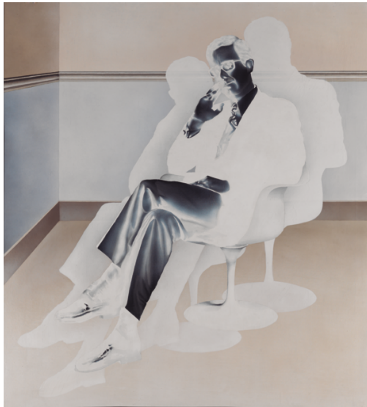
JOSÉ LUIS VERDES, COMPOSICIÓN 14, 1972. ACRÍLICO SOBRE LIENZO, 140 x 127 CM