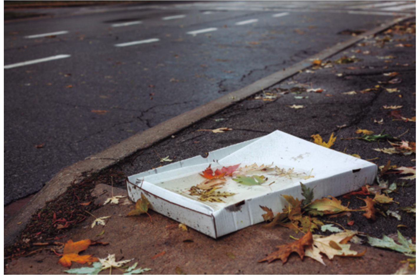
CAJA DE PIZZA. FILMBETRACHTER PIXARBY LICENSE.