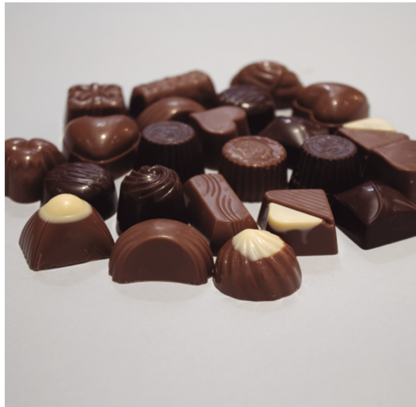
SURTIDO DE BOMBONES