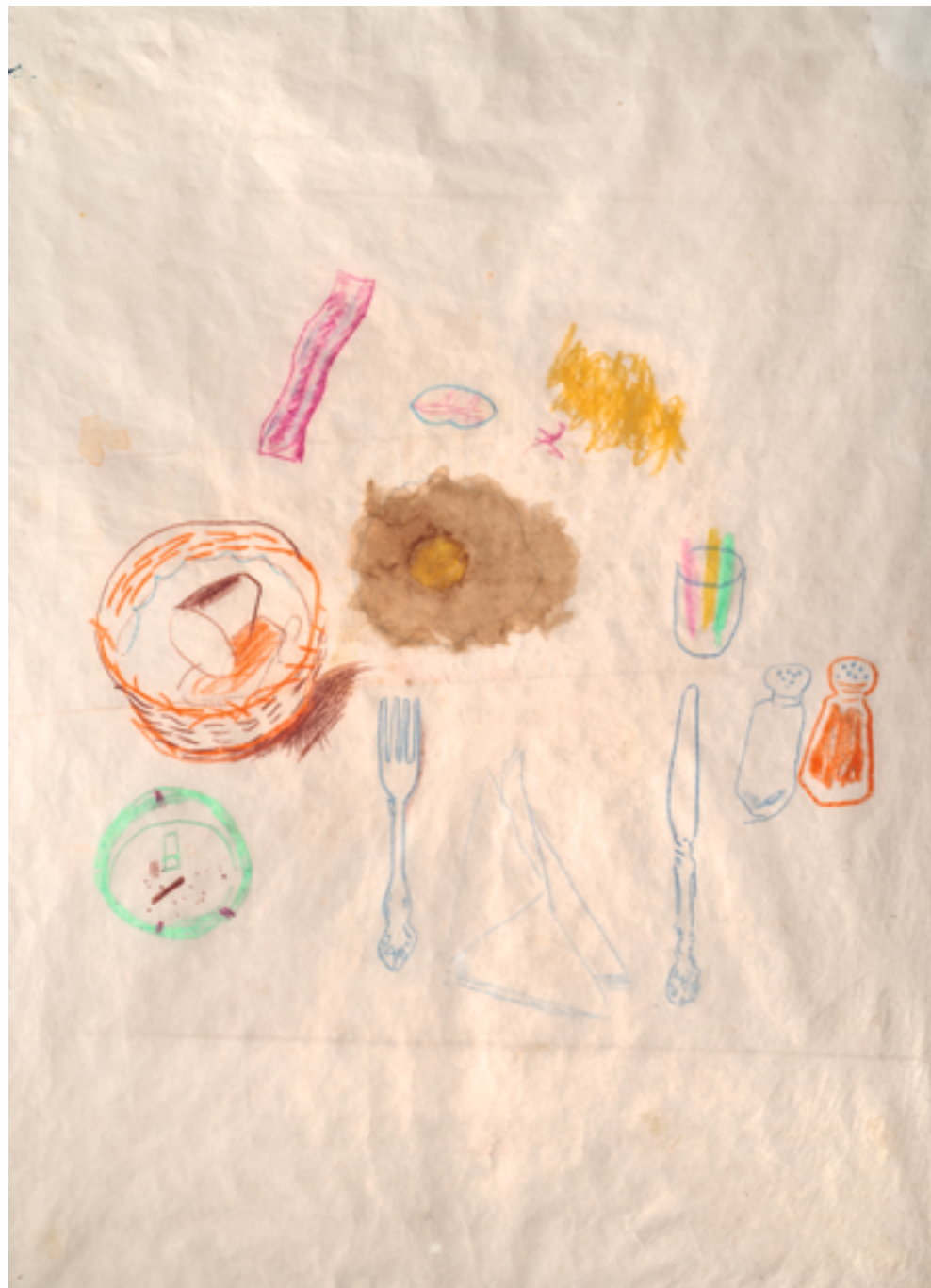
DAVID HOCKNEY, S/T, 1983. TÉCNICA MIXTA SOBRE PAPEL, 88 X 64 CM