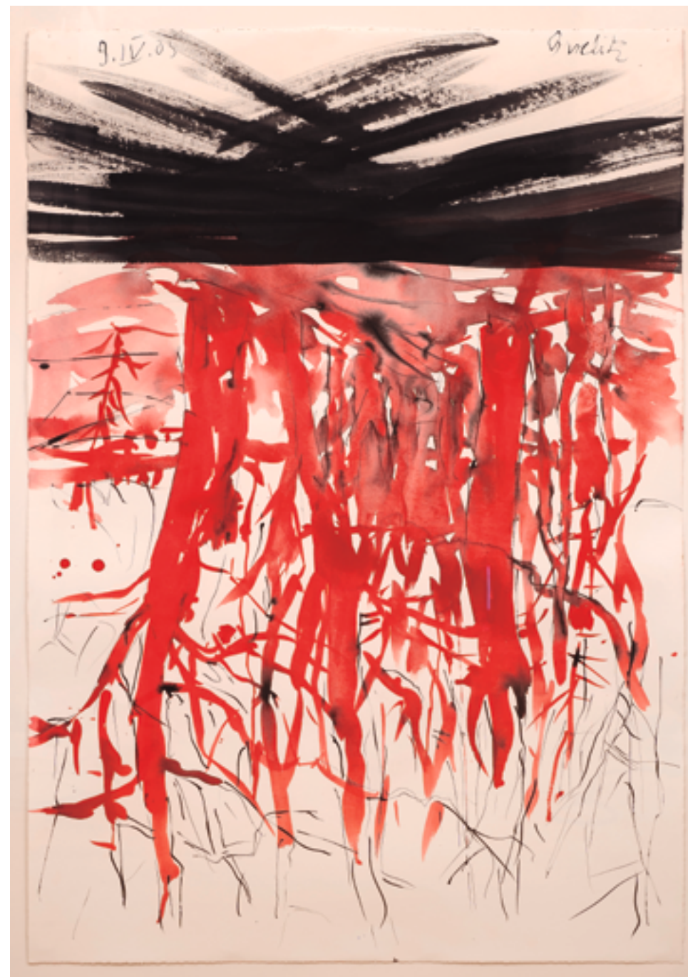
GEORGE BASELITZ, S/T, 2005. GOUACHE SOBRE PAPEL, 99 X 69 CM